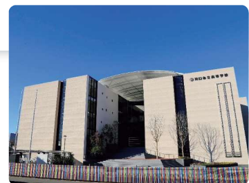
川口市立高等学校・附属中学校 校舎