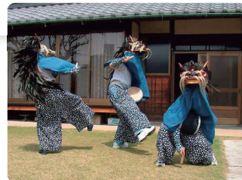
市指定無形民俗文化財 江戸袋の獅子舞