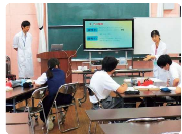
チャレンジスクール