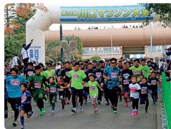
川口マラソン大会