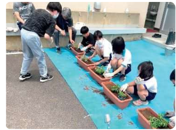
わくわくスクール