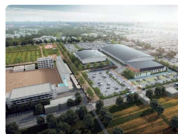
(仮称) 神根総合運動公園イメージ