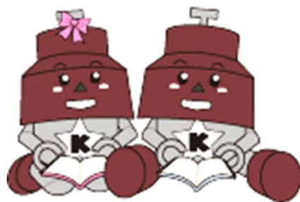
川口市マスコット「きゅぼらん」