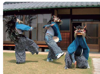
市指定無形民俗文化財 江戸袋の獅子舞