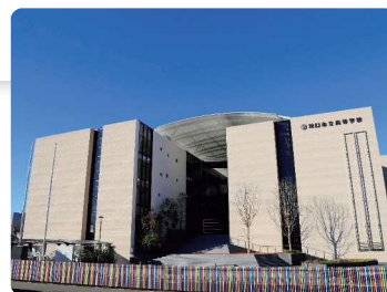
川口市立高等学校・附属中学校 校舎