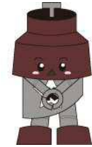
川口市マスコット 「きゅぼらん」