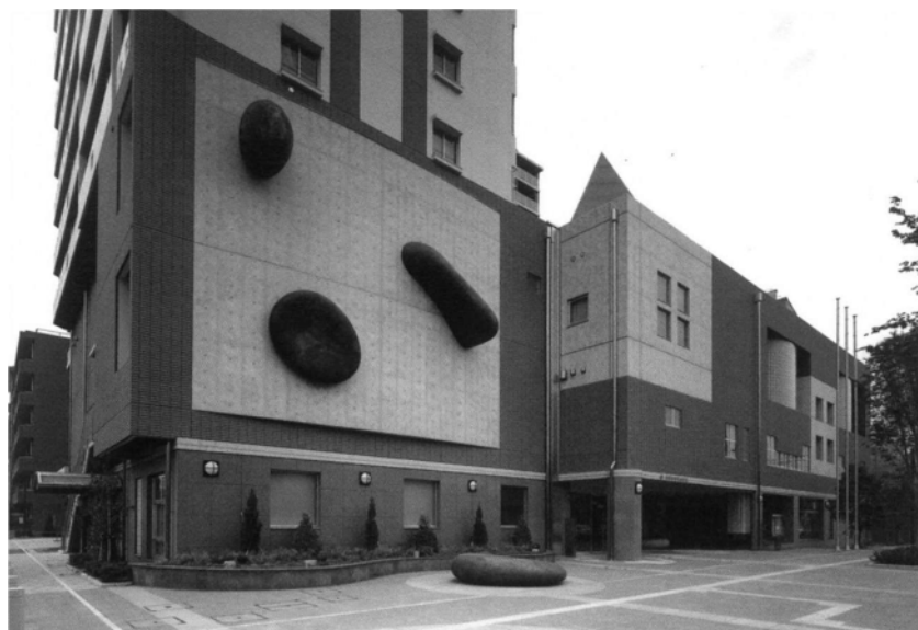
川口市立西公民館