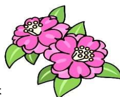
川口市の木 「さざんか」