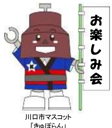
川口市マスコット 「きゅぼらん」