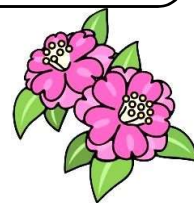
川口市の木「さざんか」