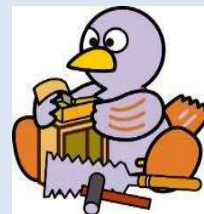
埼玉県マスコットコバトン