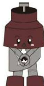
川口市マスコット 「きゅぼらん」

今後も、生涯学習活動の場として、また、町会・自治会等の地域団体の活動拠点として、利用しやすい公民館を目指して参りますので、ご理解を賜りますようお願いいたします。