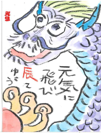
中野さんの作品です