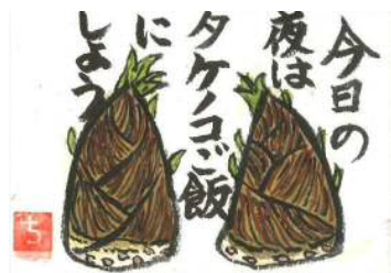
大木様の作品です