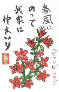
石原様の作品です