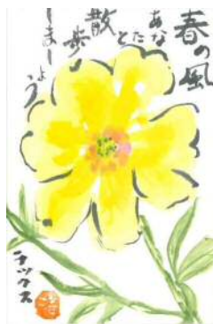
福本様の作品です