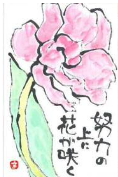
中野様の作品です