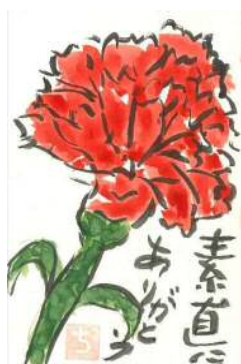
大木様の作品です