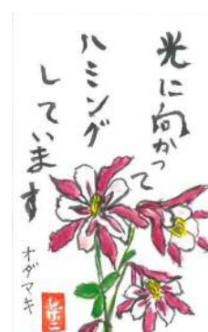
石原様の作品です