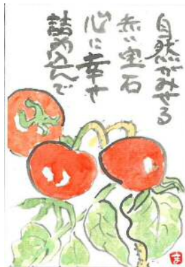
中野様の作品です