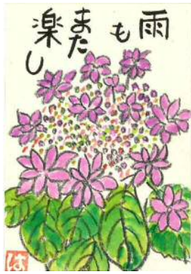
高原様の作品です