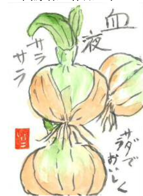
石原様の作品です