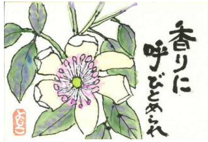
根本様の作品です