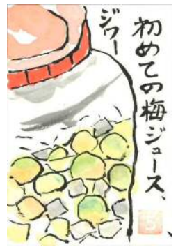
大木様の作品です