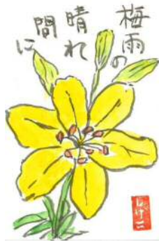
石原様の作品です