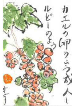
福本様の作品です