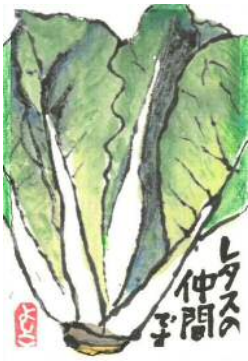
根本様の作品です