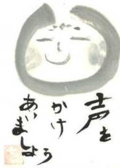
大木様の作品です