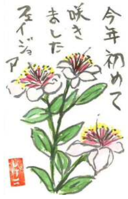
石原様の作品です