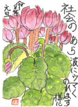
高原様の作品です