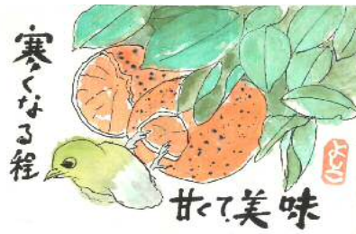
根本様の作品です