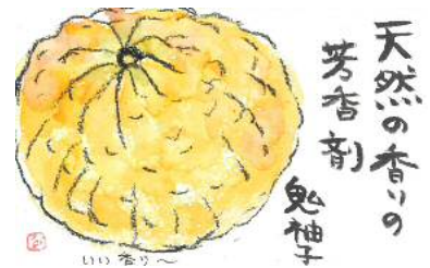
中村様の作品です