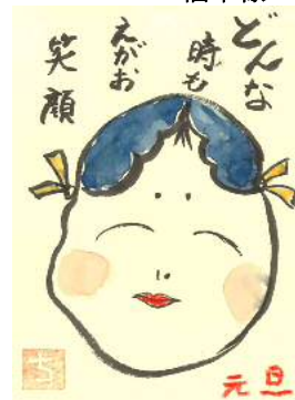
大木様の作品です