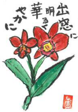
石原様の作品です