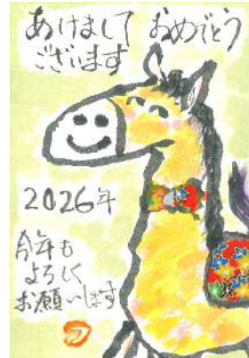
福本様の作品です