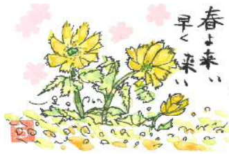
大木様の作品です