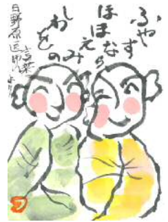
根本様の作品です