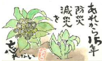
根本様の作品です