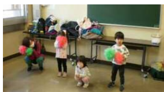
みんなでかけっこ