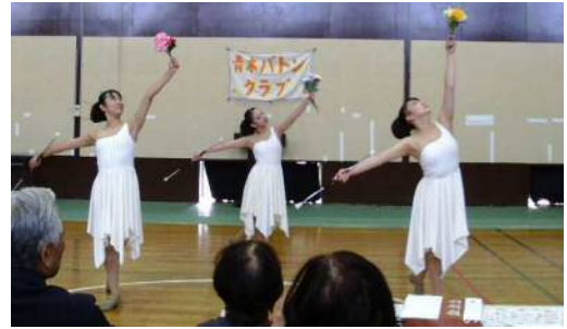
二日間にわたりホールでの発表 青木バトンクラブの 発表から始まり。