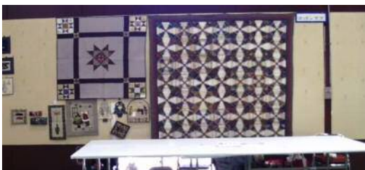
各クラブの 発表・展示