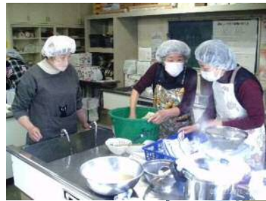
③煮あがった大豆を餅つき機に入れてつぶし、こうじと塩を加えてよく混ぜ合わせるように混ぜ、煮汁を少しずつ加え耳たぶの固さに。