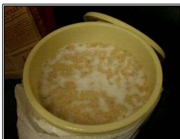
④容器を熱湯消毒してみそを詰め、表面をきれいにし、上に塩をばらばらと振って完成。しっかりとフタをして太陽のあたらない涼しい場所で保存。約1年後に完成