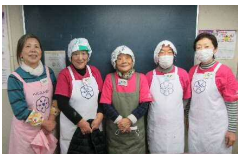
川口市食生活改善推進員協議会のみなさん

2月10日（土）に「手作り味噌講習会」を開催しました。川口市食生活改善推進員協議会 横曽根支部の皆さんに教えていただく手作り味噌は、市販のお味噌では味わえない自然の美味しさがあり、この講習会に毎年のように参加される方もいます。作ったお味噌は、熟成期間を経て今年の11月末頃に出来上がります。今から楽しみです。