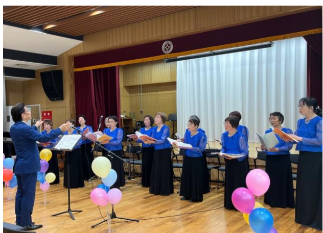
「鳩ヶ谷女声コーラス」