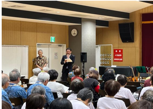
「ご来賓の船津市議よりご挨拶頂きました」