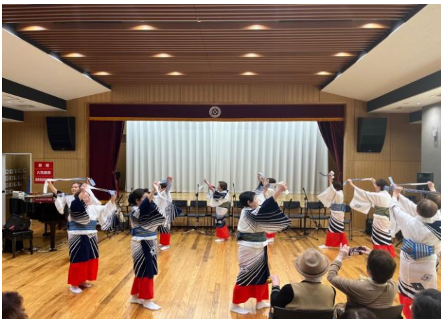
「釣り竿音頭保存会」