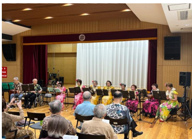
「鳩ヶ谷ウクレレクラブ」