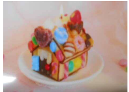
キャンドルの写真です。

日 時 7月26日(日)10時~12時 会 場 里公民館 2階ホール 今年も広い所です。 対 象 小学生 15人 参 加 費 500円 申し込み期間 6月30日(火)~7月14日(火) 里公民館窓口及び電話で受付 ※申し込み多数の場合は抽選となります! 問合わせ 里公民館 283-8171