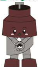
川口市マスコット「きゅぼらん」

3月2日(土)～3月3日(日) 中央ふれあい館にて 5年ぶりの文化祭を開催しました。