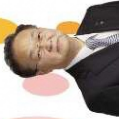
「川口の元気」を育む

「川口市教育大綱」は、市政全般の総合的な計画で市像『人と しごとが輝く しなやかでたくましい 本市における教育の振興を総合的かつ計画的に推進し