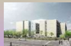
平成30年度開校 新市立高校イメージ図