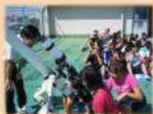
科学館(太陽観測出張授業)