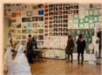
アートギャラリー