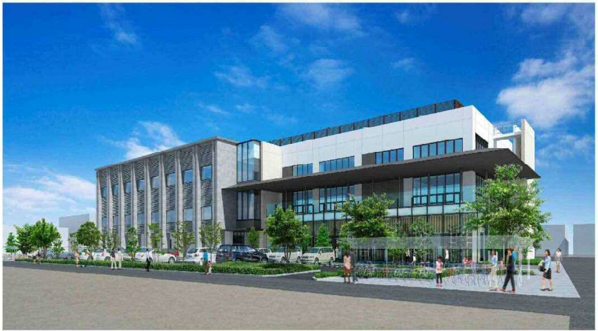
仮称西川口・横曽根公民館・横曽根図書館改築工事