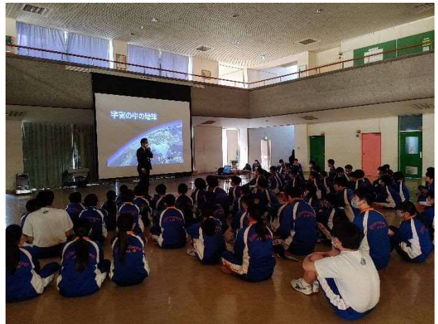
12月開催 講師派遣「宇宙の中の地球」(西中学校)