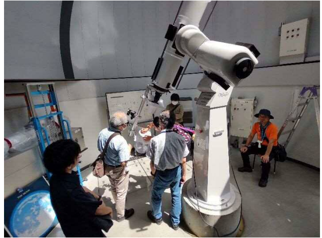
8月開催 太陽観測実習