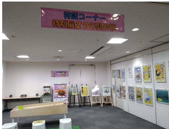
4～5月開催 開館20周年事業 特設コーナー「特別展20年間の旅」