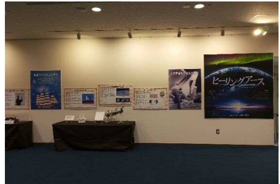
9月16日(土)～11月26日(日) 番組「ヒーリングアース」