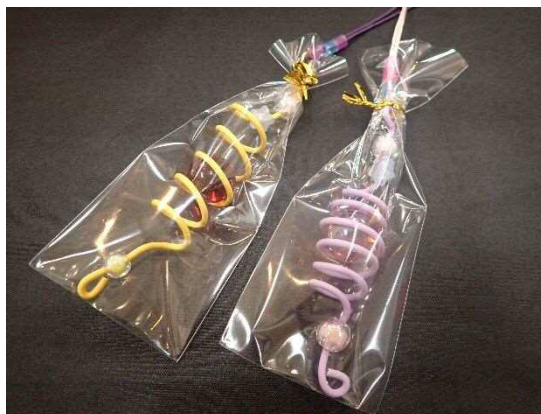
12月開催 特別展「せっかく来たから“さっかく”見ていく？」 どきどきサイエンス「体験！錯覚テーマパーク」