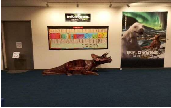
6月10日(土)～9月10日(日) 番組「新オーロラを見た恐竜たち 虹色に輝くアラスカの大地」