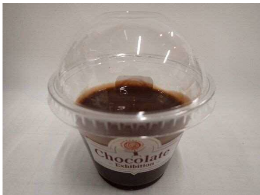
6月開催 特別展「チョコレート」 どきどきサイエンス「チョコレートスライム」