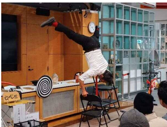
12月～2月期特別展 特別イベント「くす田博士の サイエンスアクロバットショー！」