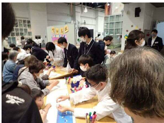
5月開催（11月にも開催） 高校生による「わくわく屋台村」