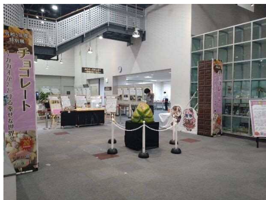
6月～7月期特別展「チョコレート」 会場写真