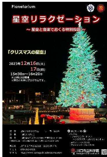
12月 星空リラクゼーション