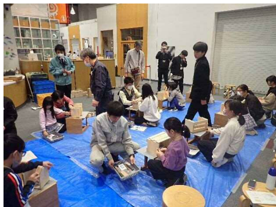
11月開催 科学ものづくり教室 「木エ スライド式ブックスタンド」