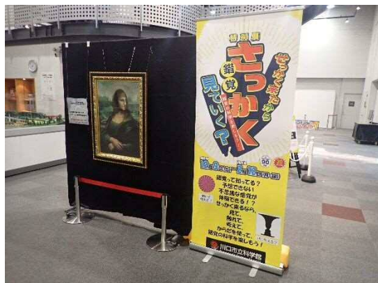
12月～2月期特別展 「せっかく来たから“さっかく”見ていく？」 会場写真