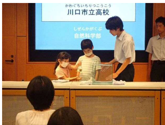
8月開催 「中学生・高校生によるサイエンス DAY」