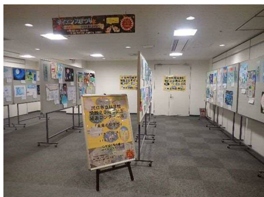
11月開催 サイエンスまつり 20周年記念事業 「未来の科学館」絵画コンクール展