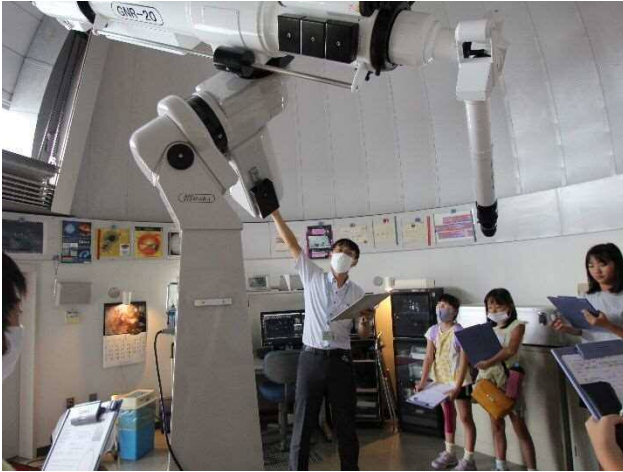
7、8月開催 夏休みこども天文教室