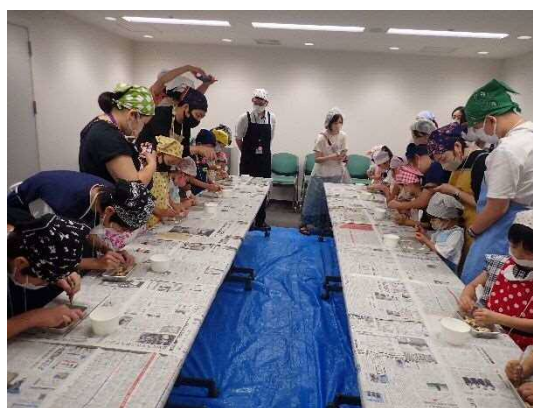
チョコレート展特別ワークショップ 「マーチくんとチョコ博士になろう」