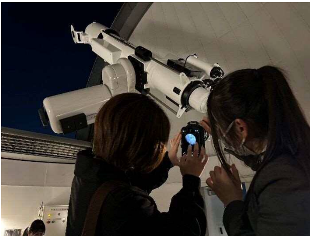
11月開催 天体撮影実習