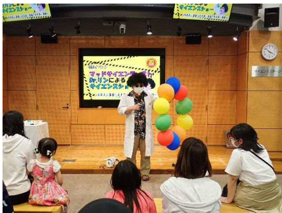
4月開催 開館20周年記念「マッドサイエンティスト・Dr.リンによるサイエンスショー」