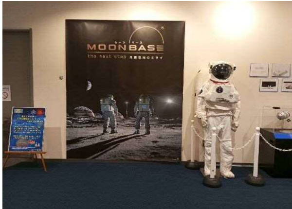
12月9日(土)～2024年2月25日(日) 予定 番組「MOONBASE(ムーンベース) 月面基地のミライ」