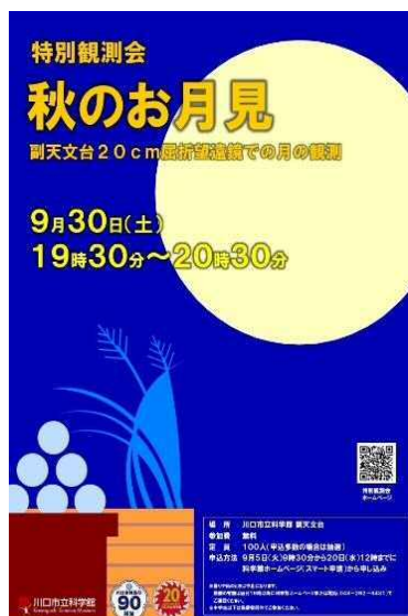
9月開催 秋のお月見