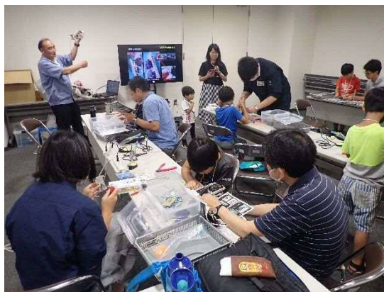
8月開催 科学ものづくり教室 「2足歩行ロボットに挑戦！」