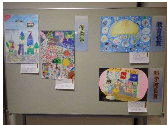
11月開催 サイエンスまつり 「未来の科学館」絵画コンクール展 教育長賞、科学館長賞、優秀賞の作品