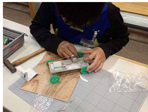
5月開催 科学ものづくり教室「マグネットカー」