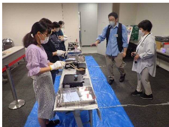
9月開催 いきいきサイエンス「オーロラ&フローラ」