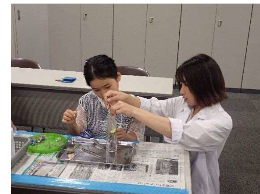
7月開催 夏休み科学教室 「世界に一つだけのハーバリウム」