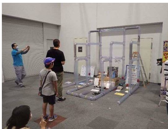
10月開催 科学ものづくり教室「メカモグラ」