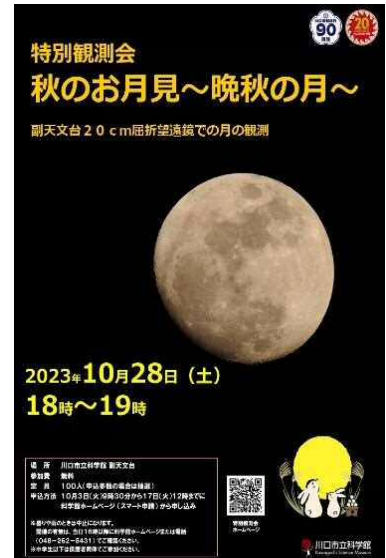
10月開催 秋のお月見～晩秋の月～