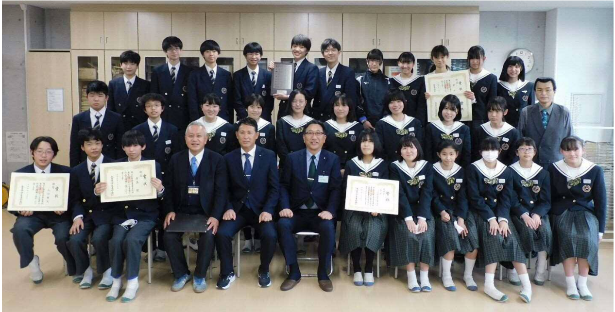
【幸並中学校美術部～全日本学生美術展「奨励賞」受賞を記念して～】