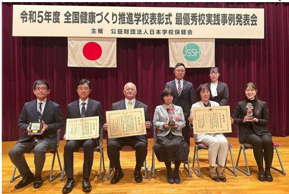
【令和6年2月10日 全国健康づくり推進学校表彰式 於：日本医師会館】 左：上青木南小学校 中央：岸川中学校 右：並木小学校