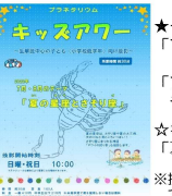
※投影日・時間はホームページでご確認ください!