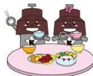
川口市マスコット「きゅぼらん」