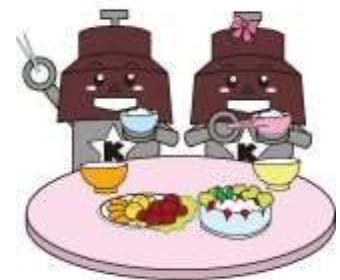
川口市マスコット「きゅぼらん」