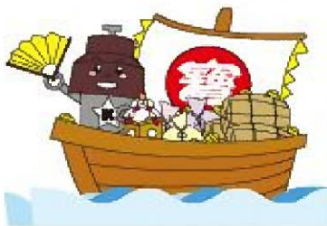
川口市マスコット「きゅぼらん」