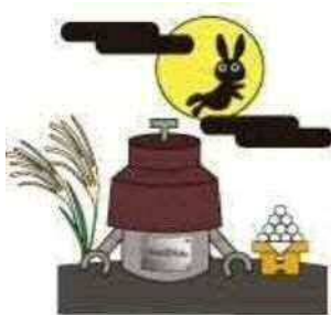
川口市マスコット「きゅぼらん」