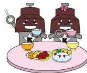
川口市マスコット「きゅぼらん」

○最終加工品における特定原材料等の総タンパク質量が数 \mu\text{g/ml} の濃度レベル又は数 \mu\text{g/mg} 含有レベルに満たない食品についても、アレルギー物質を原材料として使用していることから、極微量であっても食物アレルギー症状が起きるのを避けるために表示をしております。