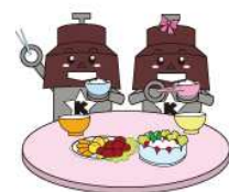
川口市マスコット「きゅぼらん」

○最終加工品における特定原材料等の総タンパク質量が数 \mu\text{g/ml} の濃度レベル又は数 \mu\text{g/mg} 含有レベルに満たない食品についても、アレルギー物質を原材料として使用していることから、極微量であっても食物アレルギー症状が起きるのを避けるために表示をしております。