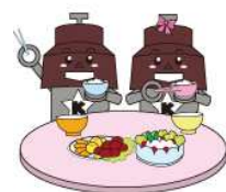
川口市マスコット「きゅぼらん」

○最終加工品における特定原材料等の総タンパク質量が数 \mu\text{g/ml} の濃度レベル又は数 \mu\text{g/mg} 含有レベルに満たない食品についても、アレルギー物質を原材料として使用していることから、極微量であっても食物アレルギー症状が起きるのを避けるために表示をしております。