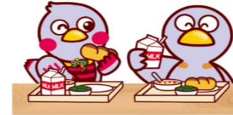
埼玉県マスコット「さいたまっち」「コバトン」