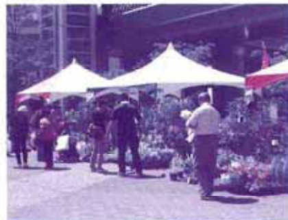
春の園芸フェスタ