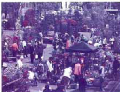
春の安行花植木まつり

4月13日(土)・14日(日)川口緑化センターで、第75回春の安行花植木まつりが開催され、植木・苗木・鉢物・草花や各種園芸資材の展示即売などが行われ、大盛況のうちに終了しました。また、6月1日(土)・2日(日)には川口駅東口公共広場(キューボラ広場)で、第15回春の園芸フェスタが開催され、生花で作る簡単コサージュ体験会を始めとして、緑花クイズやバラの花後の手入れデモンストレーションなどが行われ、家族連れなどたくさんの来場者で賑わいました。