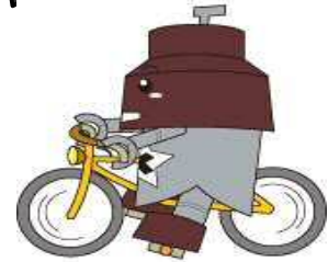
川口市マスコット きゅぼらん