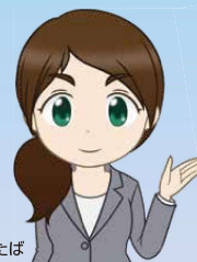
税務職員ふいたば