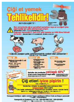
食肉による食中毒防止啓発リーフレット（トルコ語、ベトナム語）

そこで、多言語に翻訳した食品衛生に関するリーフレットを活用するとともに、廃棄物処理を所管する環境部や下水道を所管する上下水道局と合同で、駅周辺の飲食店や食品等販売店などの施設に一斉パトロールを行います。