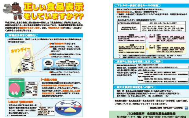
食品表示制度の案内リーフレット

市内で製造・販売・流通する食品について、窓口対応や監視指導の際に、食品を安全に摂取するために重要なアレルギー*等の衛生事項を中心に、適正表示がされるよう指導します。特に、本市においては外国人が経営する店舗が数多くあるため、安全な営業の一助となるように、多文化共生の推進を所管する市民生活部と協力し、多言語に対応したリーフレット等の作成や資料の活用をした重点的な監視指導を行います。