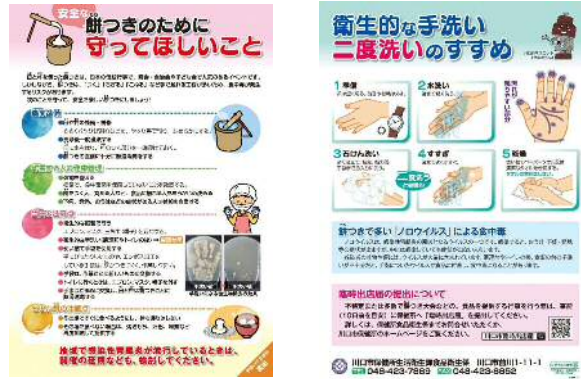
「安全な餅つきのために守ってほしいこと」リーフレット

縁日、祭礼、文化祭など地域振興のイベントで食品の提供を行う模擬店の出店を予定している主催者や市民に対し、大量調理の注意事項や提供に適した食品、検便の指導や調理者の体調管理方法等について講習会を実施します。特に、町会・自治会等の主催で開催されることが多い夏祭りや餅つき大会などの開催前には、町会・自治会回覧やホームページ等で食中毒予防の普及啓発を行うとともに、要望に応じて積極的に出前講座等を行います。また、イベント開催時には関係部局と連携し、情報共有を図り食中毒予防の普及啓発に努めます。