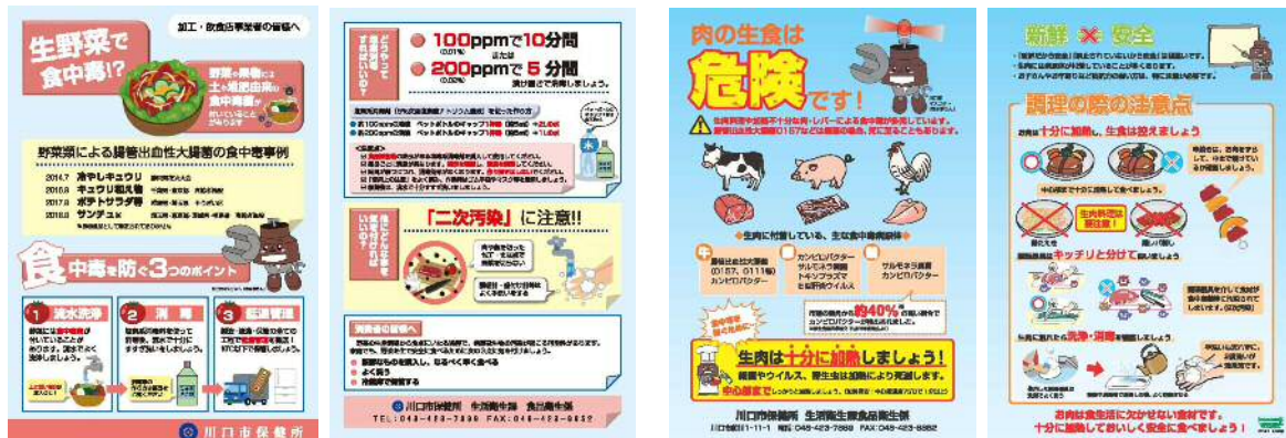
生野菜による食中毒防止啓発リーフレット

カンピロバクター* 及び腸管出血性大腸菌* による食中毒の原因の多くは、生又は加熱不十分の食肉の喫食や、調理過程での生肉等の不適切な取扱いによる二次汚染に起因していることから、生肉の取扱い状況について重点的に監視指導を行います。特に、居酒屋、焼肉店、焼き鳥屋等の飲食店については、法令で禁止されている牛肝臓及び豚肉の生食用としての提供がないこと等、規格基準の遵守の徹底を図るとともに、生肉を調理する際は、中心部まで十分な加熱調理を行うよう指導します。