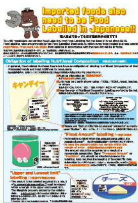
食品表示制度の案内リーフレット（英語、中国語）