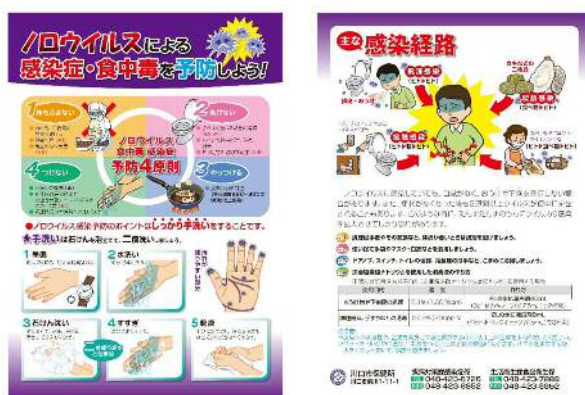
ノロウイルス食中毒防止啓発リーフレット

また、消費者については、食事前やトイレ後などの手洗いの励行やノロウイルスによる感染を広げないための家庭でできるノロウイルス消毒方法を講習会や啓発資料等を活用して普及啓発を行います。