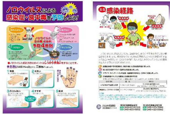
ノロウイルス食中毒防止啓発リーフレット