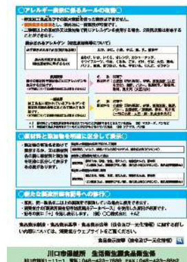
食品表示制度の案内リーフレット