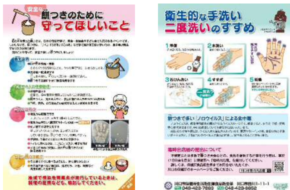
「安全な餅つきのために守ってほしいこと」リーフレット

縁日、祭礼、文化祭など地域振興のイベントで食品の提供を行う模擬店の出店を予定している主催者や市民に対し、大量調理の注意事項や提供に適した食品、検便の指導や調理者の体調管理方法等について講習会を実施します。特に、町会・自治会等の主催で開催されることが多い夏祭りや餅つき大会などの開催前には、町会・自治会回覧やホームページ等で食中毒予防の普及啓発を行うとともに、要望に応じ積極的に出前講座等を行います。また、イベント開催時には関係部局と連携し、情報共有を図り食中毒予防の普及啓発に努めます。