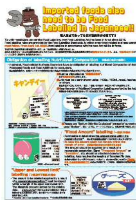
食品表示制度の案内リーフレット（英語、中国語）