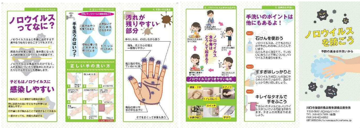
「ノロウイルスを防ごう」リーフレット