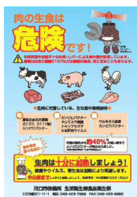
食肉による食中毒防止啓発リーフレット