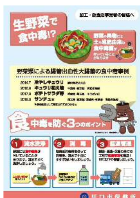
生野菜による食中毒防止啓発リーフレット

カンピロバクター* 及び腸管出血性大腸菌* による食中毒の多くは、生又は加熱不十分な食肉の喫食や、調理過程での生肉等の不適切な取扱いによる二次汚染に起因していることから、生肉の取扱い状況について重点的に監視指導を行います。特に、居酒屋、焼肉店、焼き鳥屋等の飲食店については、牛肝臓及び豚肉の生食又は加熱不十分な状態での提供がないよう、中心部まで十分な加熱調理を行い、規格基準の遵守を徹底するよう指導します。