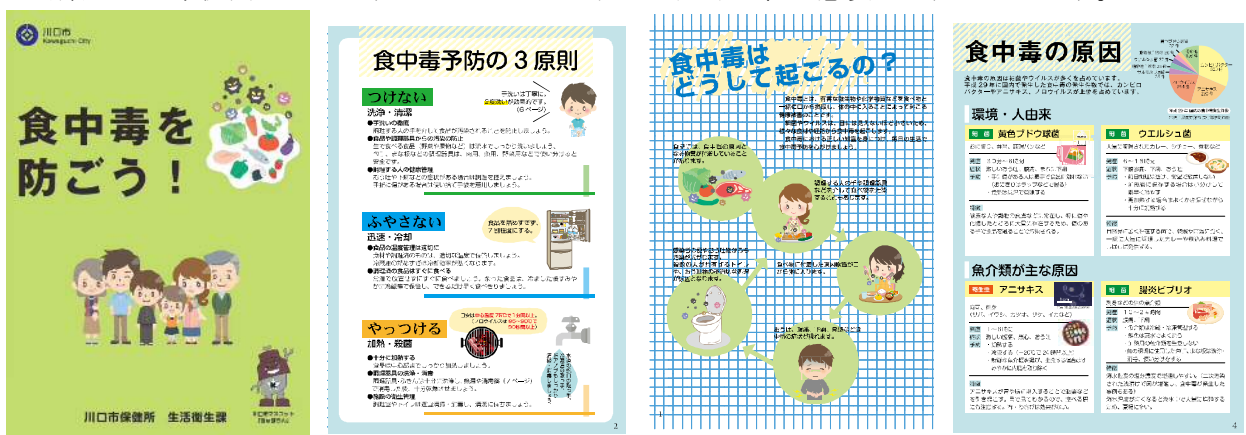
「食中毒を防ごう！」リーフレット