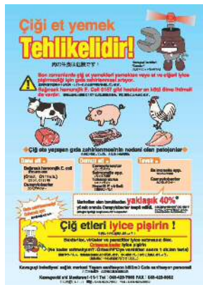
食肉による食中毒防止啓発リーフレット（トルコ語、ベトナム語）

そこで、多言語に翻訳した食品衛生に関するリーフレットを活用するとともに、廃棄物処理を所管する環境部や下水道を所管する上下水道局と合同で、駅周辺の飲食店や食品等販売店などの施設に一斉パトロールを行います。