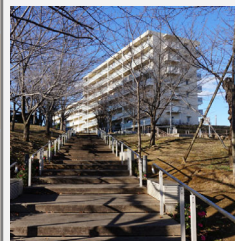
◀東鳩ヶ谷団地の建替え