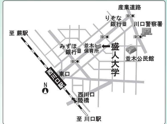
▲盛人大学案内図 JR西川口駅東口徒歩3分 かわぐち市民パートナーズステーション分室 (盛人大学キャンパス)

メールアドレス seijin50@city.kawaguchi.saitama.jp