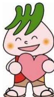
川口市社協マスコット 社助