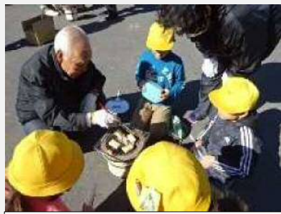
地域と連携した授業（学校応援団）