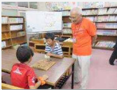
地域の運営による放課後子供教室