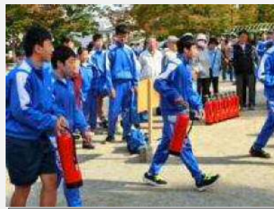
学校と自治会の連携による防災訓練