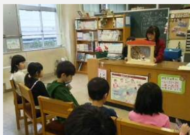
図書室での読み聞かせ