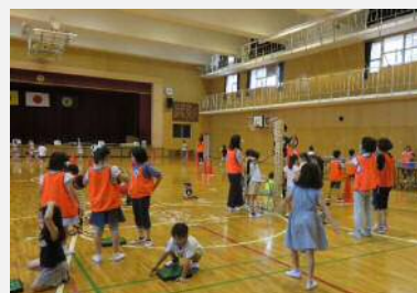
体育館での自由遊び