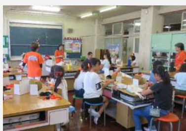
家庭科室での工作