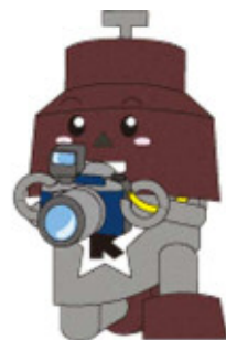
川口市マスコット 「きゅぼらん」