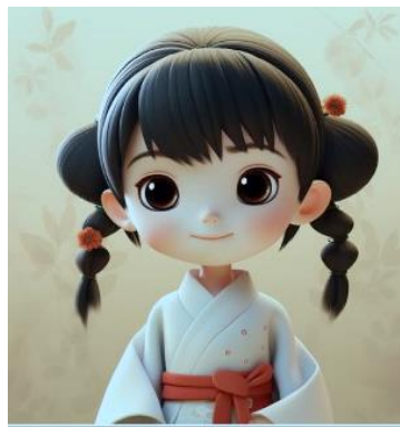
イメージキャラクター(予定)