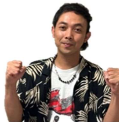
てい い べるまだ デフィ パルマタ いんどねしあ (インドネシア)