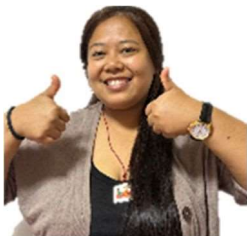
らま あすみた ラマ アスミタ ねーる (ネパール)