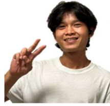
むはまっど どに ムハマッド ドニ たあじゅていん タアジュティン いんどねしあ (インドネシア)