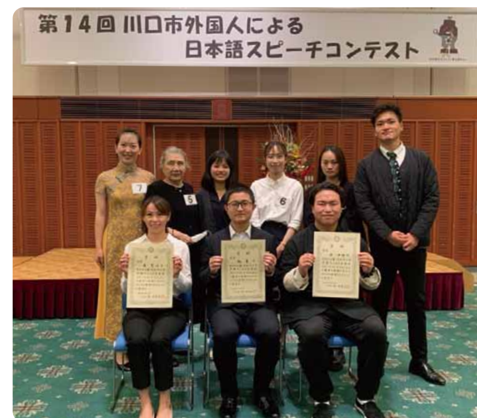
※写真は「第14回川口市外国人による 日本語スピーチコンテスト」の様子です。

川口市 市民生活部 協働推進課 多文化共生係 〒332-0015 川口市川口1-1-1 キュポ・ラ本館棟 M4階 電話:048-227-7607 FAX:048-226-7718